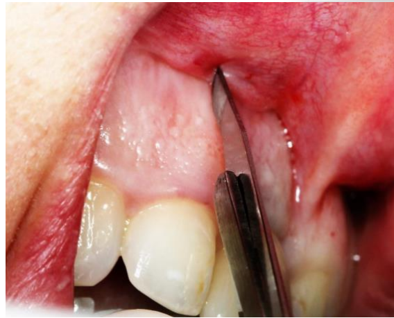
Figura 3 - Incisão vertical realizada na distal do dente 11