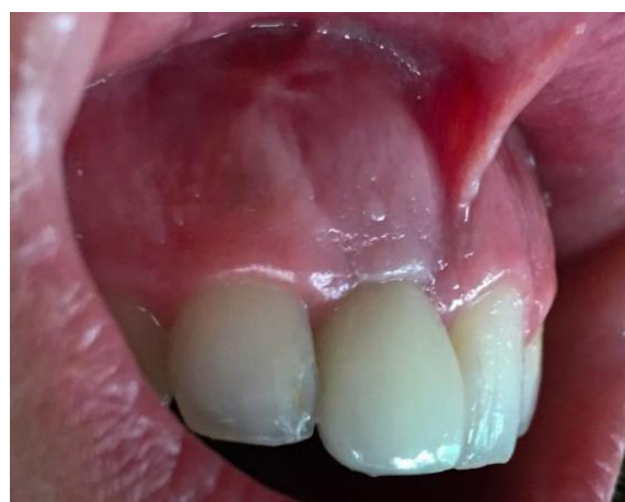
Figura 7 - Pós-operatório 5 meses

Os medicamentos prescritos para o pós-operatório foram amoxicilina 500mg de 8 em 8 horas por 7 dias, dipirona sódica 500mg de 6 em 6 horas por 3 dias. As suturas foram removidas após 10 dias e o pós-operatório acompanhado por 30 dias (Figuras 7,8).