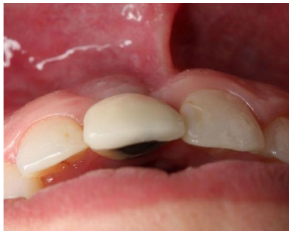
Figura 2 - Fenótipo gengival delgado

Este trabalho foi submetido à aprovação do Comitê de Ética em Pesquisa (CEP) da Faculdade Patos de Minas (FPM) e aprovado sob a CAAE: 19361519.6.0000.8078 e número do Parecer: 3.360.917, de acordo com as atribuições definidas na Resolução CNS 466/12. Após estar ciente de todos os procedimentos a qual seria submetida (inclusive sobre os riscos e benefícios), a paciente assinou o Termo de Consentimento Livre e Esclarecido (TCLE).