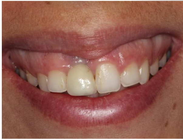
Figura 1 - Aspecto inicial

A paciente apresentou-se sistemicamente normal dentro das condições de idade, e seus dados foram registrados em prontuário. No exame clínico intraoral, constatou-se que a paciente apresentava uma condição estética insatisfatória relacionada à região periimplantar devido ao fenótipo gengival delgado e mau posicionamento do implante que se encontrava vestibularizado (Figura 2). O tratamento proposto para a paciente foi Enxerto de Tecido Conjuntivo (ETC) subepitelial, pela técnica de Túnel Modificado, com o objetivo de melhorar a qualidade de tecido na área do elemento 11e, consequentemente a estética.