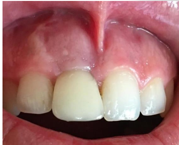
Figura 8 - Acompanhamento de 5 meses