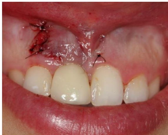
Figura 6 - Suturas

Os medicamentos prescritos para o pós-operatório foram amoxicilina 500mg de 8 em 8 horas por 7 dias, dipirona sódica 500mg de 6 em 6 horas por 3 dias. As suturas foram removidas após 10 dias e o pós-operatório acompanhado por 30 dias (Figuras 7,8).