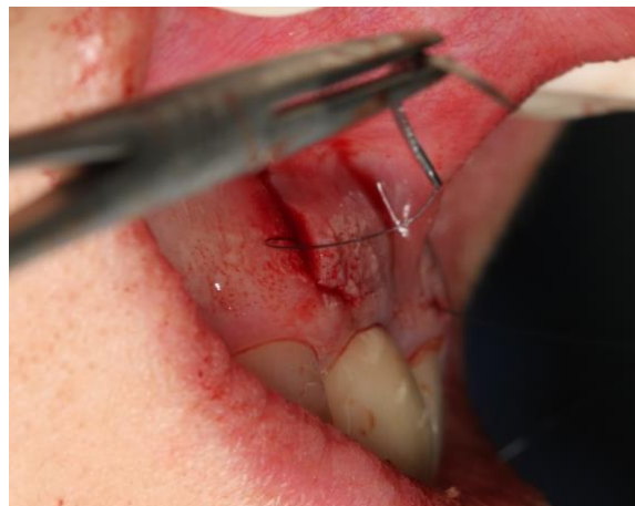
Figura 5 A - Introdução da agulha para captura do enxerto

O ETC foi removido do palato pela técnica de alçapão e levado à área receptora para sutura com fio de nylon 5-0. Introduziu-se a agulha na extremidade mesial não cruenta com a finalidade de capturar o enxerto e deslizar-lo por dentro do túnel, saindo com a agulha próximo à área de sua entrada para finalização da sutura. O ETC foi estabilizado na extremidade distal e a incisão vertical fechada por suturas simples (Figuras 5 A, 5 B, 6).